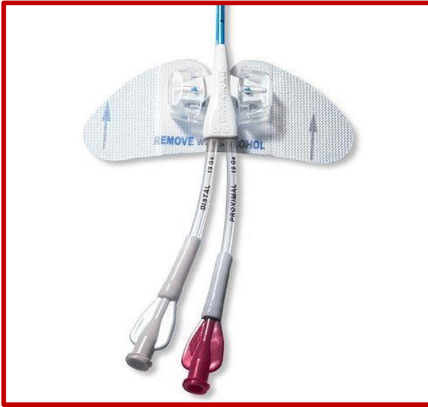
Εικόνα 1. Συσκευή σταθεροποίησης ΚΦΚ χωρίς ραφή